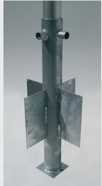
Nedstøbningsrør sidebetjent 90533