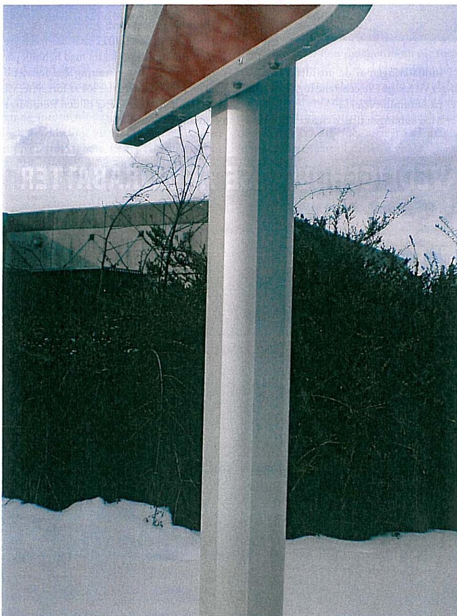
Figur 1. Seri Pole eftergivelige mast – passer til alle miljøer.

Mastens endelige form blev en ottekant, som er cirkulær domineret, men med 4 plane sider for montering af udstyr. Overfladen fremstår helt glat uden riller eller spor og falder naturligt ind i såvel et tættere bymiljø som i det åbne land (se figur 1).